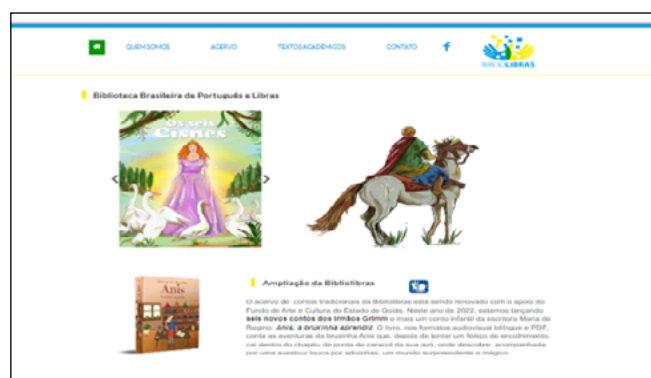
Figura 1 – Captura de tela da página inicial da Biblioteca virtual “Bibliolibras”

O corpus da pesquisa compõe-se do acervo virtual de livros audiovisuais para surdos e ouvintes acompanharem a leitura e a interpretação de contos em Libras, bem como de prints da própria Biblioteca Virtual Bilíngue Bibliolibras 1 (Bibliolibras, 2021).