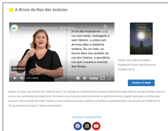
Figura 3 – Captura de tela do livro “A bruxa da rua das acácias” da Biblioteca virtual “Bibliolibras”

voltada, principalmente, para o público leitor surdo, por apresentar uma linguagem múltiplas e híbrida (sonora, visual e escrita), já o e-book é no formato do livro impresso.