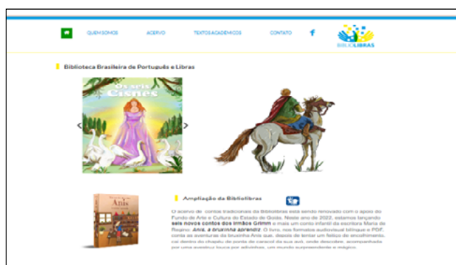
Figura 1 – Captura de tela da página inicial da Biblioteca virtual “Bibliolibras”

O corpus da pesquisa compõe-se do acervo virtual de livros audiovisuais para surdos e ouvintes acompanharem a leitura e a interpretação de contos em Libras, bem como de prints da própria Biblioteca Virtual Bilíngue Bibliolibras 1 (Bibliolibras, 2021).